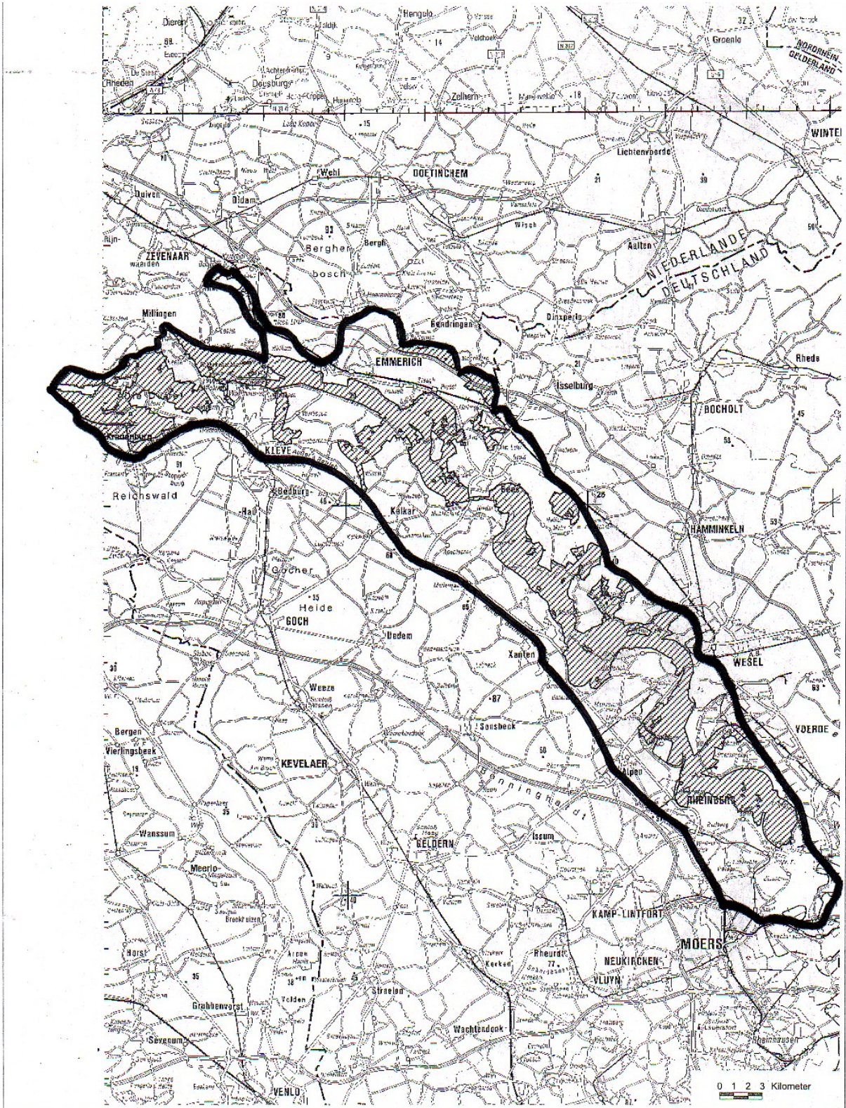
Schongebiet „Untere Niederrhein“ gem. § 3 Nr. 6 a) der Landesjagdzeiten-VO (Schraffierte Flächen = DE-4203-401 Vogelschutzgebiet „Untere Niederrhein“)